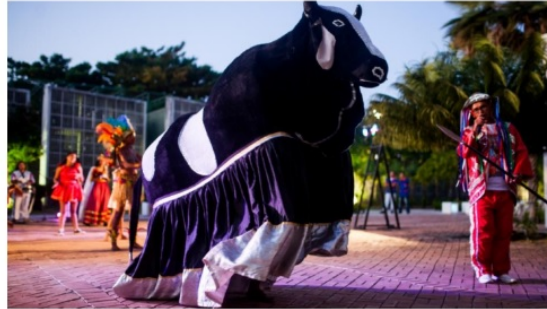
A programação da Semana do Folclore segue até domingo (12), com oficinas e apresentações culturais.

O equipamento cultural, por meio do Programa Educativo Gente Arteira, ofertas mesas redondas, oficinas e apresentações culturais em homenagem ao Dia do Folclore Nacional