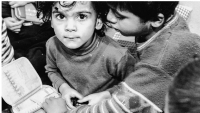
Crianças sírias refugiadas e acolhidas em Gaziantep, na Turquia

Estão abertas as inscrições para a oficina de Fotografia e Direitos Humanos da Caixa Cultural Fortaleza