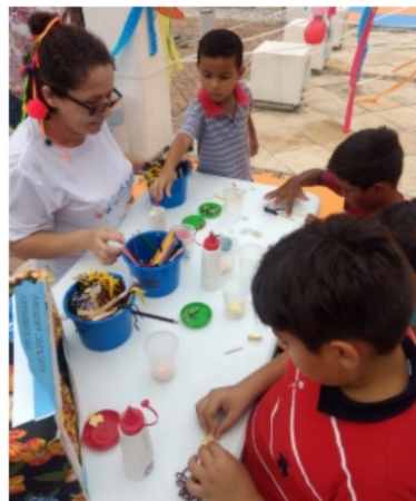
O trabalho infantil terá oficinas de origami, de desenho, palhaço e pintura de rosto.

Com programação para adultos e crianças, a Caixa Cultural Fortaleza terá o fim de semana bastante ativo. Com foco nas crianças, o equipamento receberá o musical "Os Saltimbancos", espetáculo que acompanha as andanças de uma galinha, um hamster, um cachorro e uma gata, que decidem se reunir para buscar uma oportunidade de mudar de vida por meio da música. A montagem será encenada neste sábado, 2, e partir das 18 horas, conduzida pelo grupo Coral Soul Cantor, do Conservatório de Música Alberto Nepomuceno.