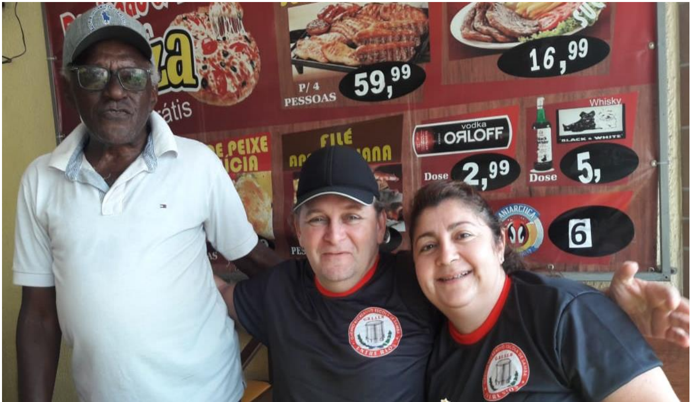
PROJETOS EM APROVADOS E EM ANÁLISE