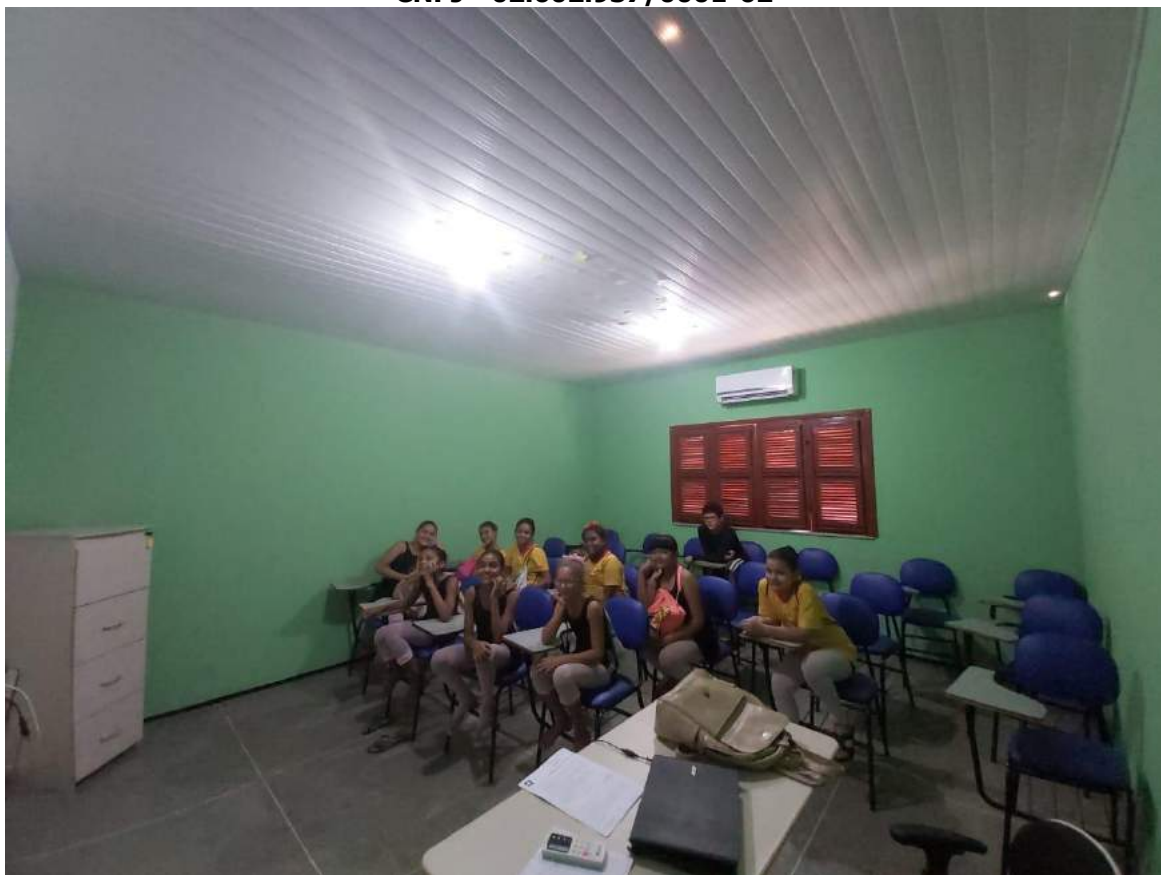
Resumo sobre os Filmes