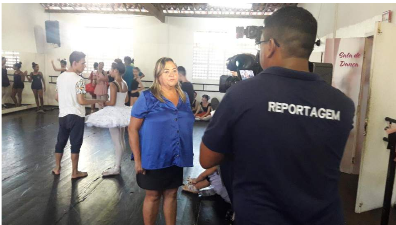
APRESENTAÇÃO DO GRUPO BCAD EM RORAIMA