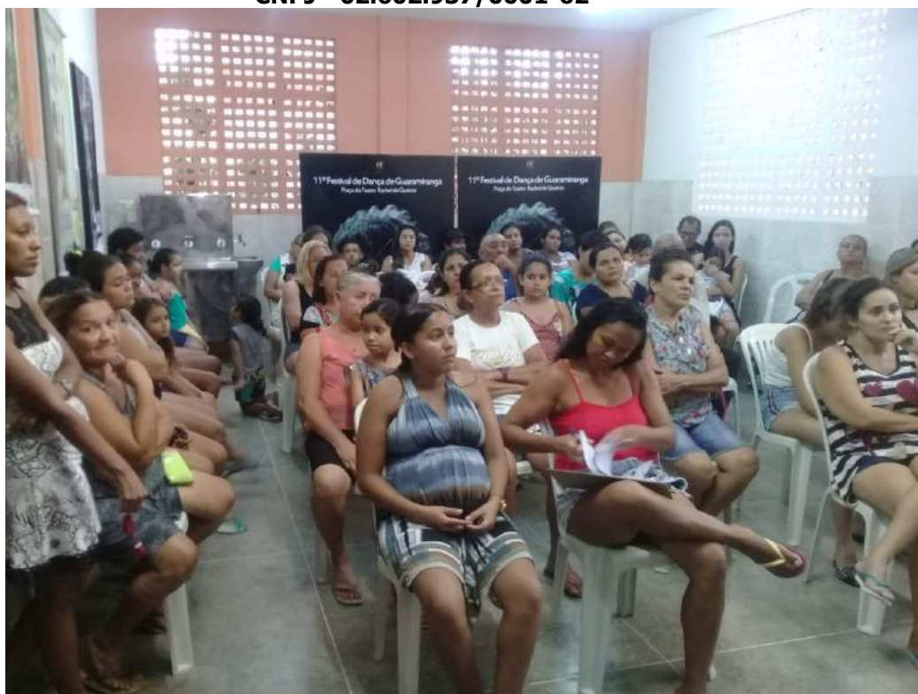
PALESTRA SOBRE FAMILIA CIDADÃ

Grupo Bailarinos de Cristo Amor e Doações – BCAD Uma Escola para a Vida Sede Rua Paraná, 03 – Bela Vista - CEP: 60.441-240. Telefax (85) 3482-7100 - Fortaleza - CE CNPJ - 02.602.937/0001-62