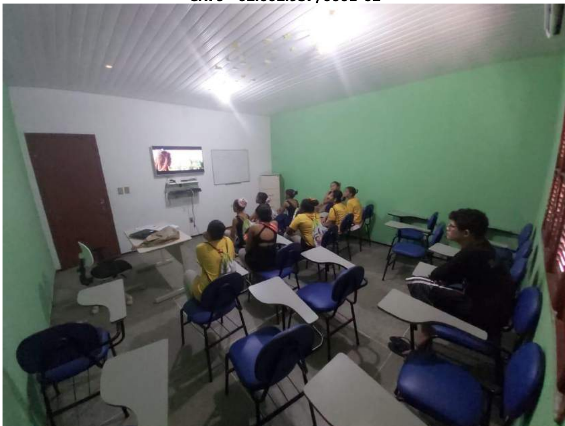
Resumos sobre os Filmes;

Grupo Bailarinos de Cristo Amor e Doações – BCAD Uma Escola para a Vida Sede Rua Paraná, 03 – Bela Vista - CEP: 60.441-240. Telefax (85) 3482-7100 - Fortaleza - CE CNPJ - 02.602.937/0001-62