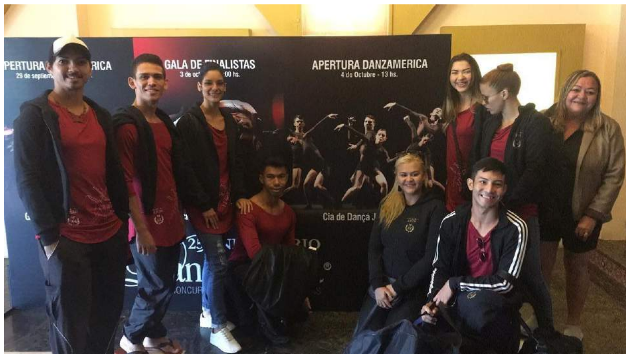
Apresentações Fora do estado do Ceara - Mossoró