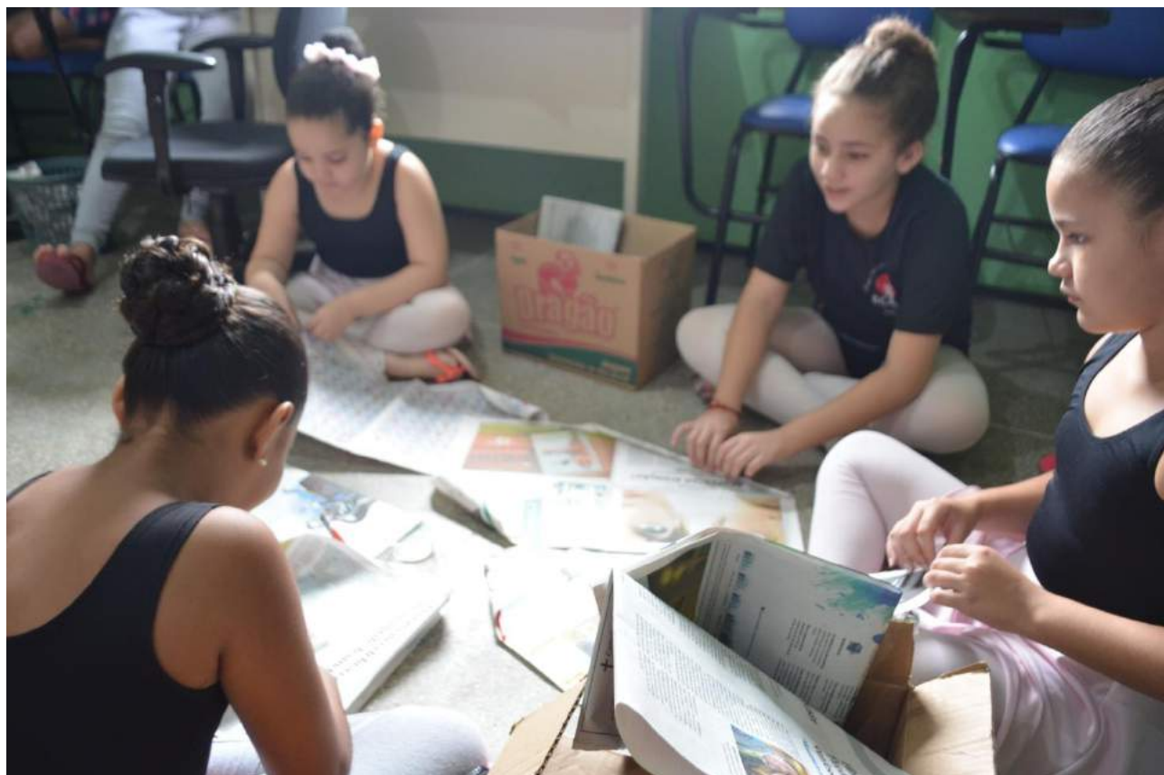
Aulas de Musica

Grupo Bailarinos de Cristo Amor e Doações – BCAD Uma Escola para a Vida Sede Rua Paraná, 03 – Bela Vista - CEP: 60.441-240. Telefax (85) 3482-7100 - Fortaleza - CE CNPJ - 02.602.937/0001-62 Aulas de Artes