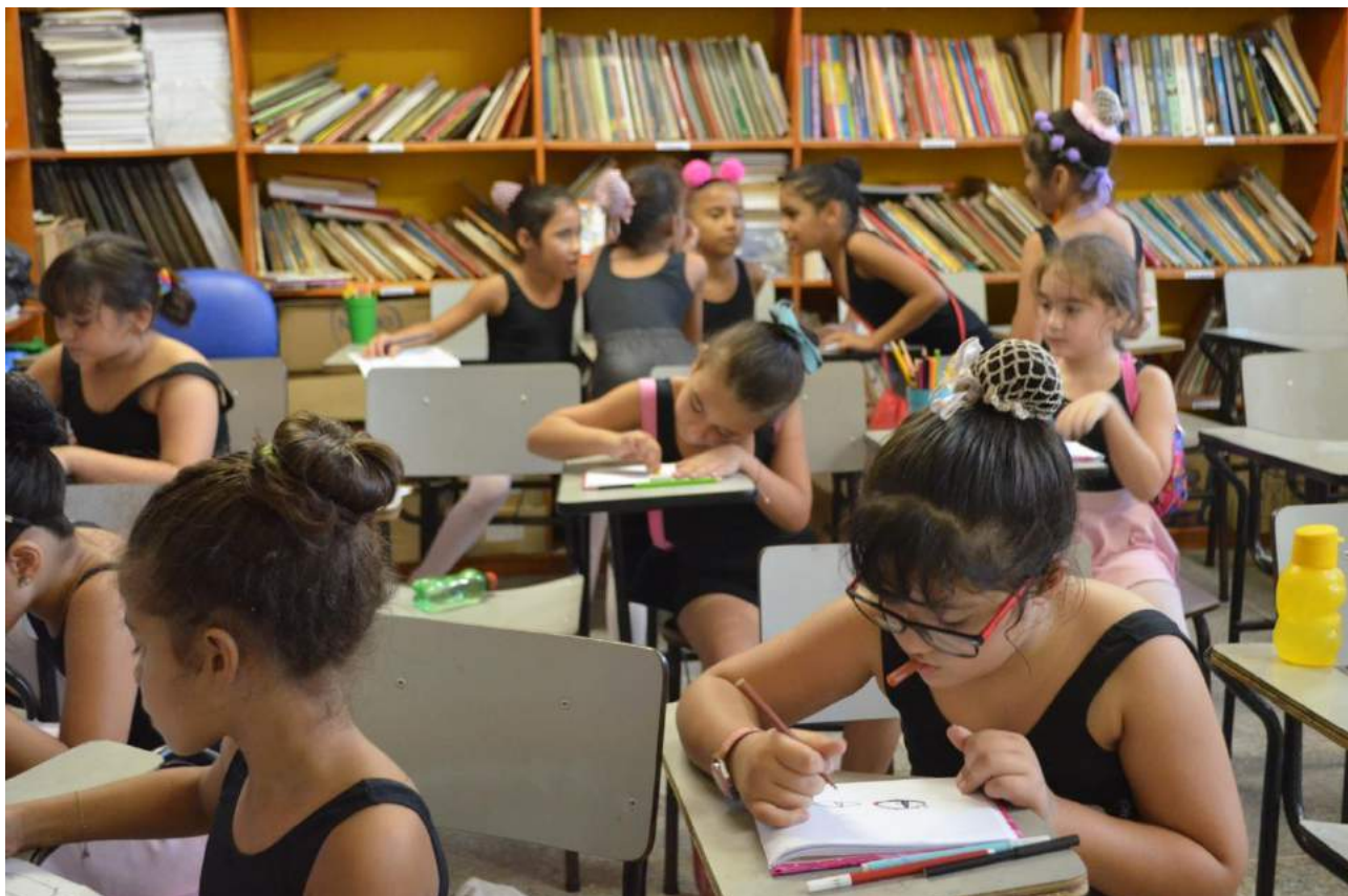
REPORTAGEM SETEMBRO 2019

Grupo Bailarinos de Cristo Amor e Doações – BCAD Uma Escola para a Vida Sede Rua Paraná, 03 – Bela Vista - CEP: 60.441-240. Telefax (85) 3482-7100 - Fortaleza - CE CNPJ - 02.602.937/0001-62 Aulas de Apoio Pedagógico