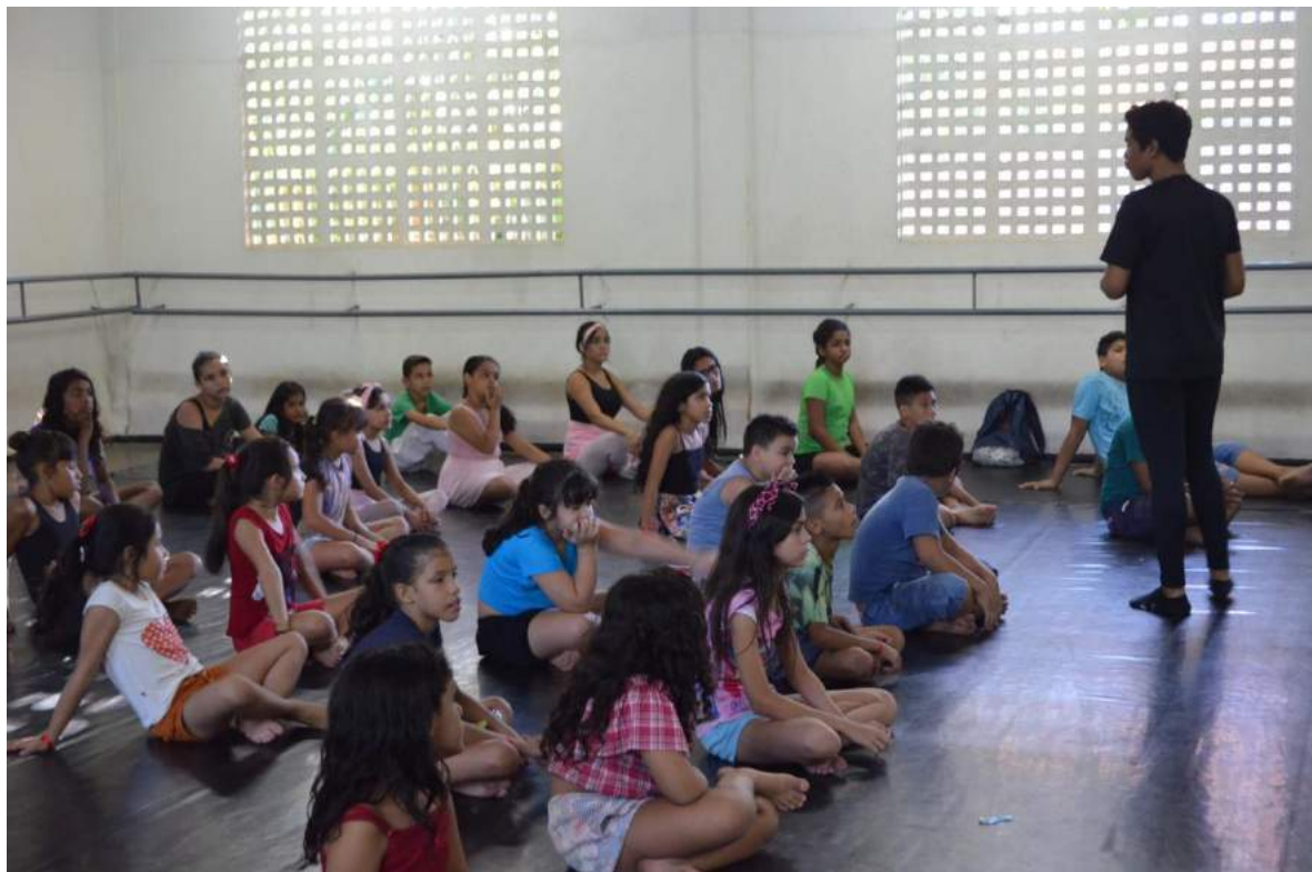
Edições de pequenos Videos

Grupo Bailarinos de Cristo Amor e Doações – BCAD Uma Escola para a Vida Sede Rua Paraná, 03 – Bela Vista - CEP: 60.441-240. Telefax (85) 3482-7100 - Fortaleza - CE CNPJ - 02.602.937/0001-62 Palestras e Exibições de Filmes;