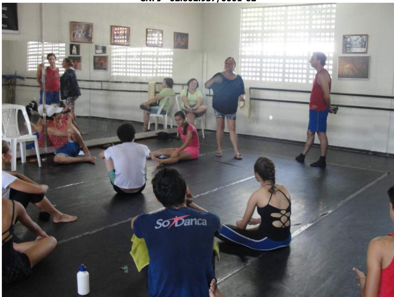
Palestras para Turmas Infantis;

Grupo Bailarinos de Cristo Amor e Doações – BCAD Uma Escola para a Vida Sede Rua Paraná, 03 – Bela Vista - CEP: 60.441-240. Telefax (85) 3482-7100 - Fortaleza - CE CNPJ - 02.602.937/0001-62