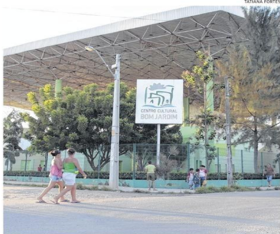
Fachada do Centro Cultural Bom Jardim. Assessoria de imprensa da Secult afirma que uma nova equipe deve assumir a gerência do espaço a partir de julho deste ano

Conforme a assessoria de imprensa da Secretaria da Cultura estadual, uma ampla reforma no CCBJ está sendo planejada pelo Departamento de