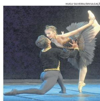
3.500 artistas brasileiros e estrangeiros participam do festival

O Festival Internacional de Dança de Fortaleza (Fendafor) completa, em 2015, quinze anos de atividades como um dos principais eventos de dança do país. Iniciado ontem, 28, e com programação que segue até o próximo domingo, 5, no Teatro José de Alencar, este ano o festival retine 3.500 artistas de 11 estados brasileiros e de países, como Argentina, Canadá e Chile. No evento dialogam diversas linguagens da dança, em um intercâmbio de cultura, talento e oportunidades.