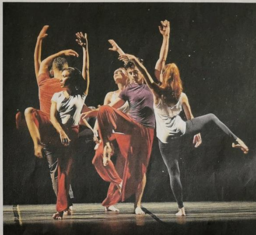
Das Tanztheater Baden und die brasilianische Compagnie «Cia. Dança-Libras» haben gemeinsam das Kurzstück «EX-change» aufgeführt – sowohl in Baden als auch in Fortaleza.