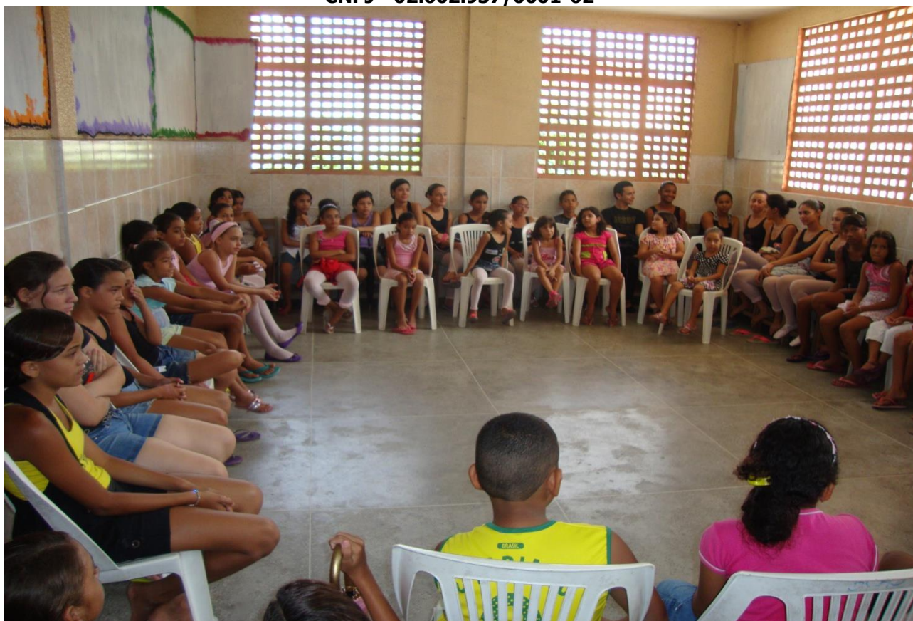
MOSTRA DE ARTES - ESPETÁCULOS COM OS 500 ALUNOS ATENDIDOS ANUALMENTE

Grupo Bailarinos de Cristo Amor e Doações – BCAD Uma Escola para a Vida Sede Rua Paraná, 03 – Bela Vista - CEP: 60.441-240. Telefax (85) 3482-7100 – 85 988907977 - Fortaleza - CE CNPJ - 02.602.937/0001-62