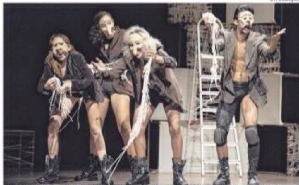
Calígulas , do grupo Comedores de Abacaxi S/A. Atração do programa Teatro da Terça, hoje, às 20h

A programação reunirá os 194 projetos artísticos selecionados pelos Editais Culturais 2015/2016. Durante um ano, a Temporada trará 438 apresentações ao todo.