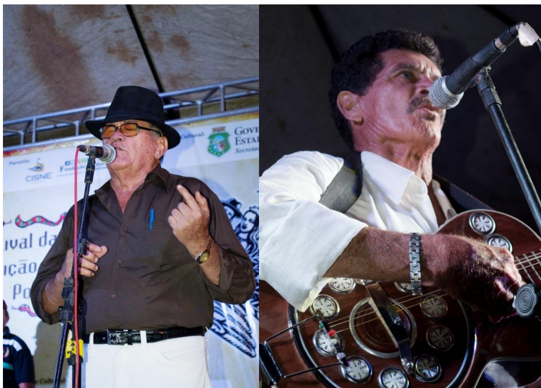
Violeiros e Repentistas