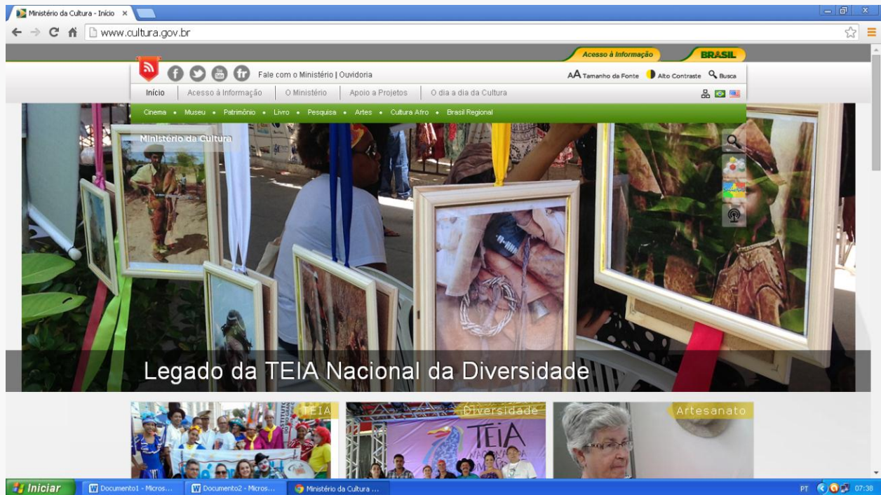
Foto de Capa do Ministério da Cultura – Exposição o Vaqueiro e o Couro. O INSTITUTO integrou as ações do TEIA 2014.

Produção de Várias Exposições em Artes Visuais, entre elas o Vaqueiro e Couro, que integrou a Mostra Artística do TEIA nacional 2014.