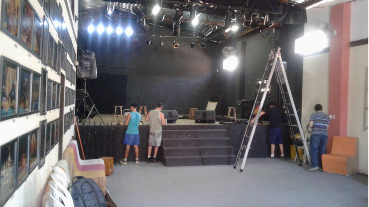
Sobre o Café Teatro das Marias: