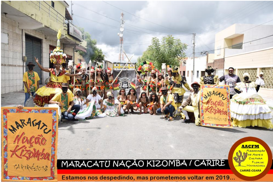
MARACATU NAÇÃO KIZOMBA / CARIRÉ