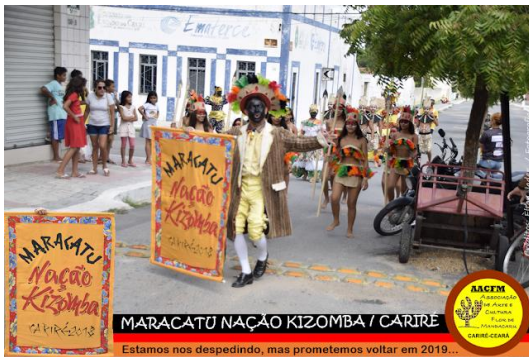
MARACATU NAÇÃO KIZOMBA / CARIRÉ