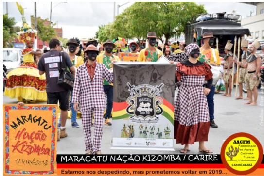
MARACATU NAÇÃO KIZOMBA / CARIRÉ