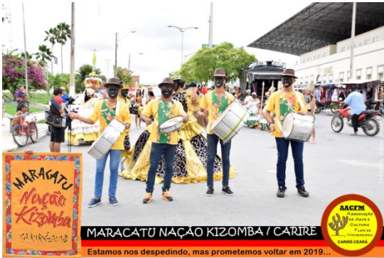
MARACATU NAÇÃO KIZOMBA / CARIRÉ