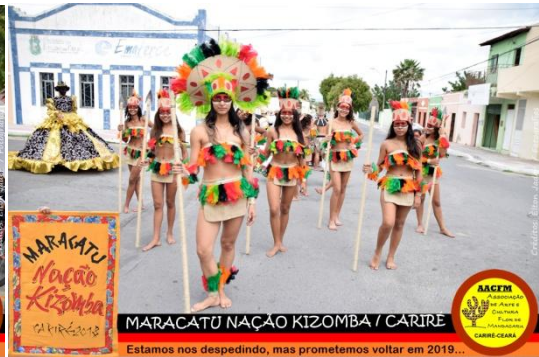
MARACATU NAÇÃO KIZOMBA / CARIRÉ