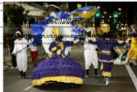
O Filhos de Iemanjá foi fundado em 15 de agosto de 2008, data na qual se comemorou os 100 anos de Umbanda no Brasil

IMPRIMIR (https://www.fortaleza.ce.gov.br/noticias/conjunt...)