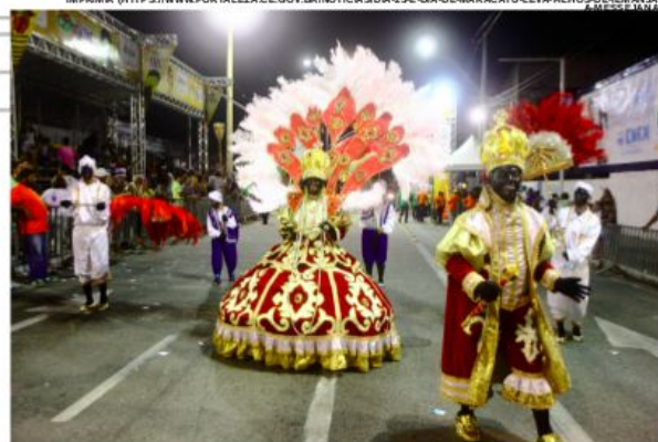
A cada dia 25, o projeto leva maracatus a diversos pontos da cidade

IMPRIMIR (HTTPS://WWW.FORTALEZA.CE.GOV.BR/NOTICIAS/DIA-25-E-DIA-DE-MARACATU-LEVA-FILHOS-DE-EMANJA-MESSEJANA)