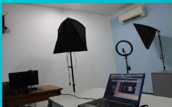
GRAVAÇÕES DE MÍDIAS

AMCTN ASSOCIAÇÃO DOS MORADORES DO CONJUNTO TANCREDO NEVES