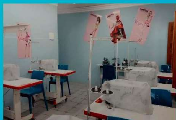
ATELIÊ DE COSTURA