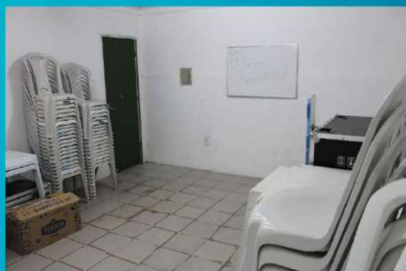
SALA DE CURSOS