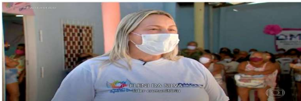
Face cruel da fome: mulheres relatam rotina de buscar comida em caminhão de lixo

Uma cena comovente, revoltante, se espalhou em redes sociais esta semana: um grupo de mulheres vasculhando um caminhão de lixo em busca de sobras de alimentos.