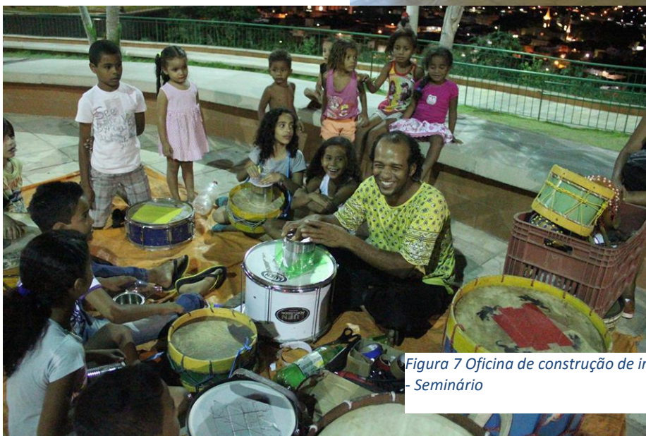
Figura 7 Oficina de construção de instrumentos com material reciclado com crianças do Vulcão - Seminário