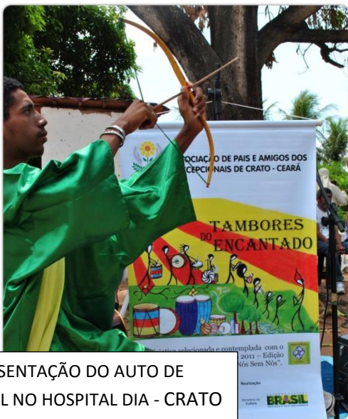
APRESENTAÇÃO DO AUTO DE NATAL NO HOSPITAL DIA - CRATO