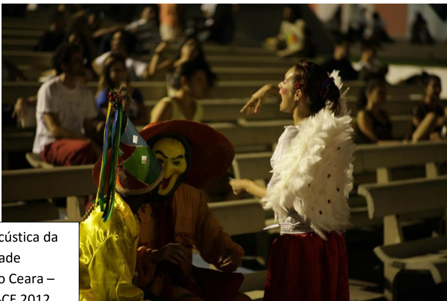
Orquestra Acústica da Universidade Federal do Ceará – Fortaleza-CE 2012