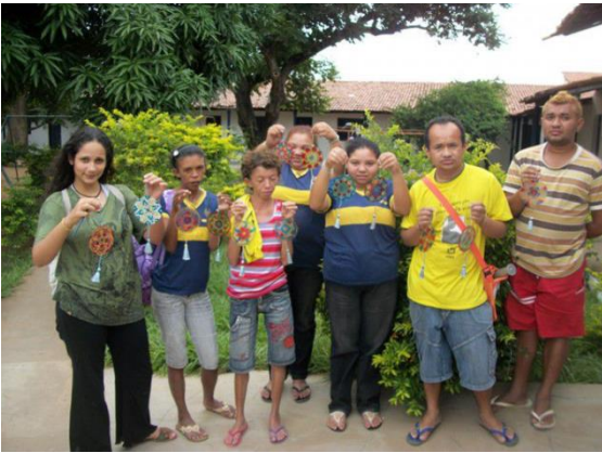
Figura 12 Oficina produção de mandalas com material reciclado (CD's) com alunos da APAE-Crato