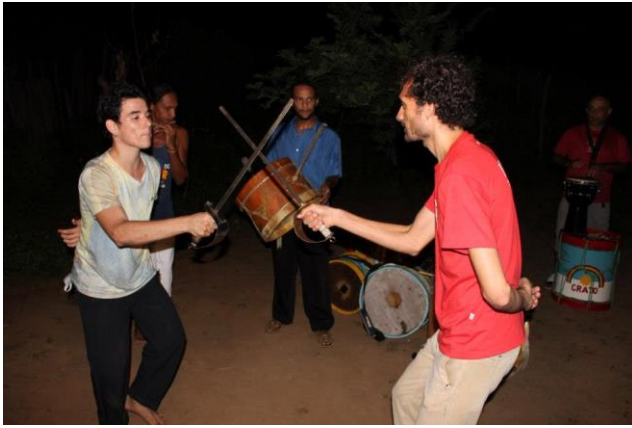
Figura 14 Oficina de espadas no Sítio Belo Horizonte - Crato-CE