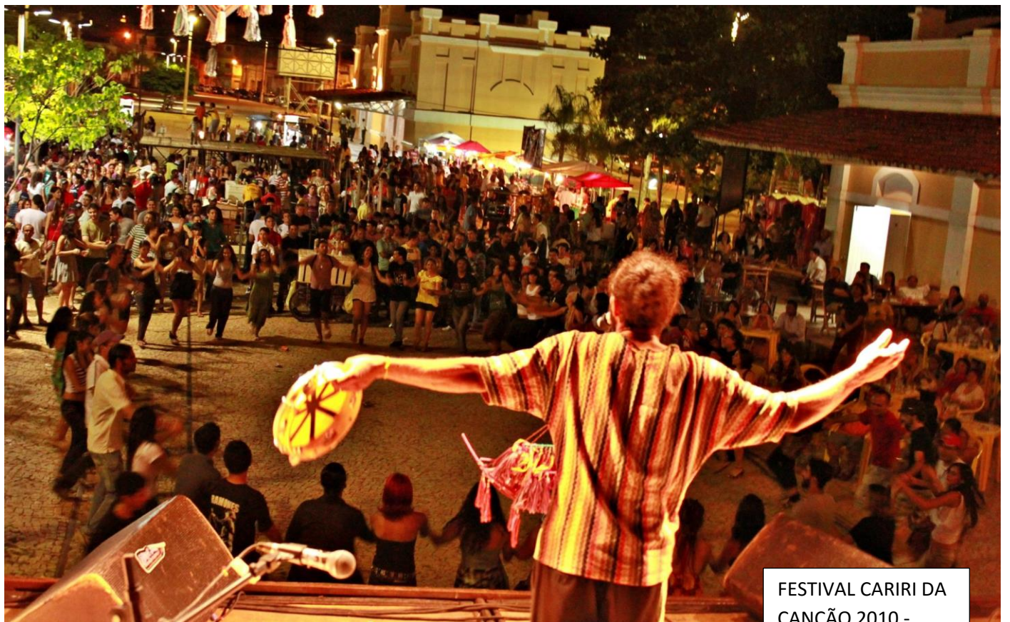
FESTIVAL CARIRI DA CANÇÃO 2010 - CONVIDADA