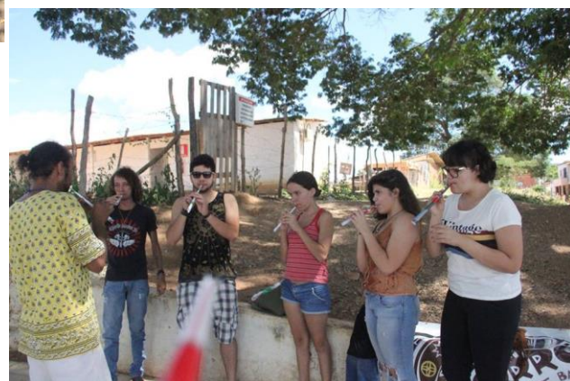
Figura 2 Oficina de apito-corneta com material reciclado – canudo e papel