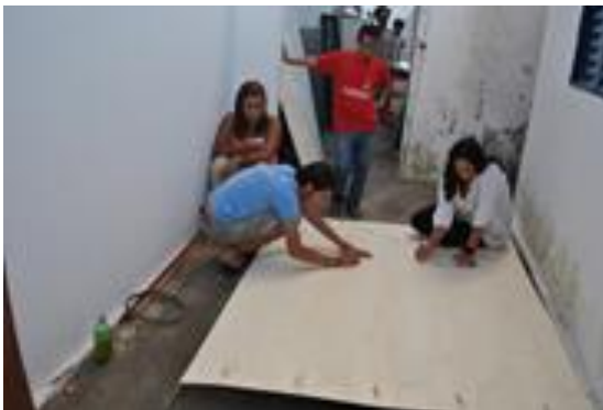
Figura 9 OFICINA CONSTRUÇÃO DE TAMBORES