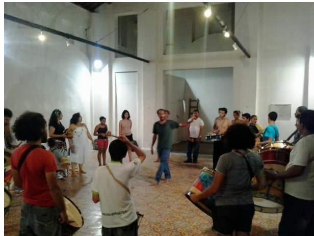
Figura 13 OFICINA ZABUMBAR - PERCUSSÃO