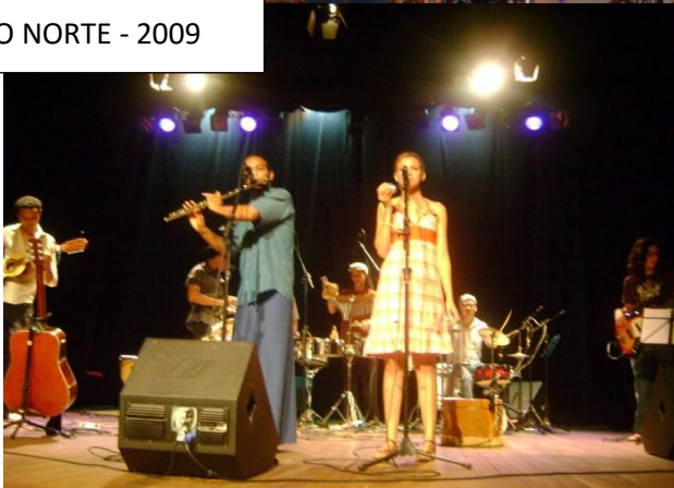
CCBNB JUAZEIRO DO NORTE - 2009