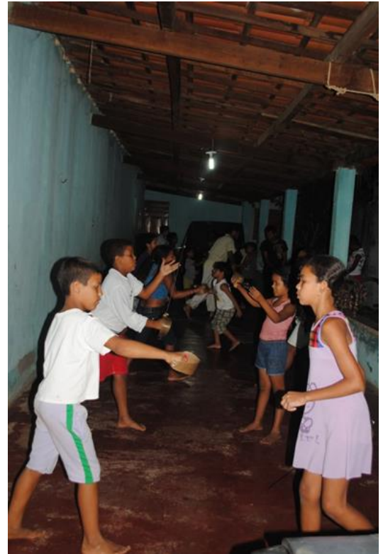
Figura 4 Oficina de Espada de Reisado com crianças no Juazeiro do Norte-CE