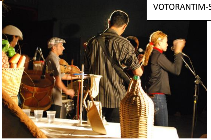
2009 – VIOLAS, CAUSOS E CRENDICES – VOTORANTIM-SP