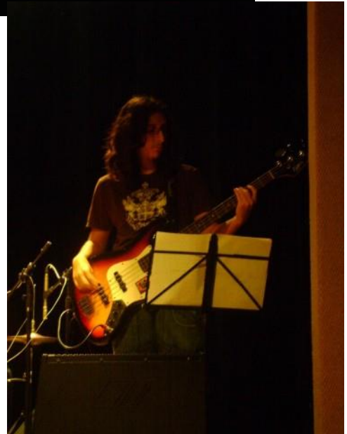
2009 – CENTRO CULTURAL BANCO DO NORDESTE DA PARAIBA E UNIVERSIDADE FEDERAL DA PARAIBA http://www.boanoticia.org.br/noticias_detalhes.php?cod_secao=1&cod_noticia=346