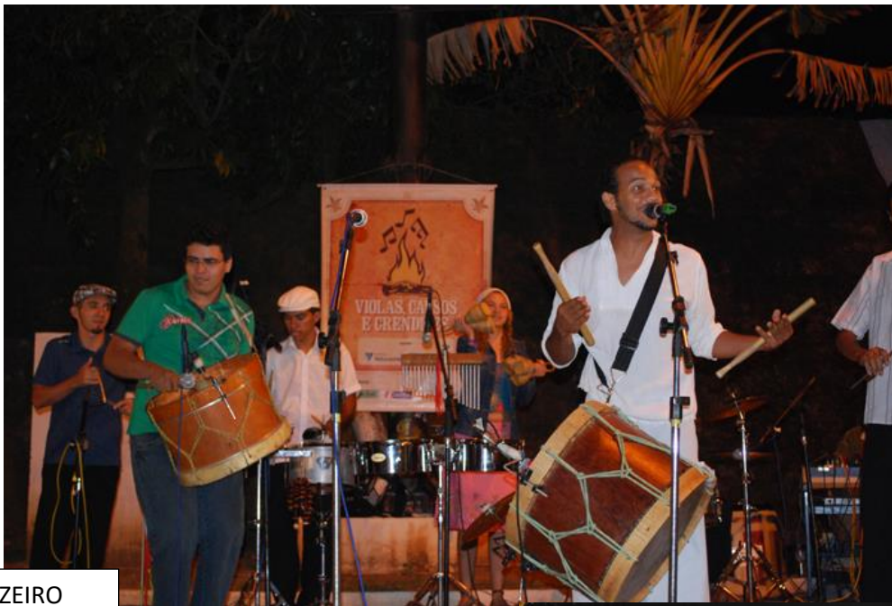
2009 – VIOLAS, CAUSOS E CRENDICES – VOTORANTIM-SP