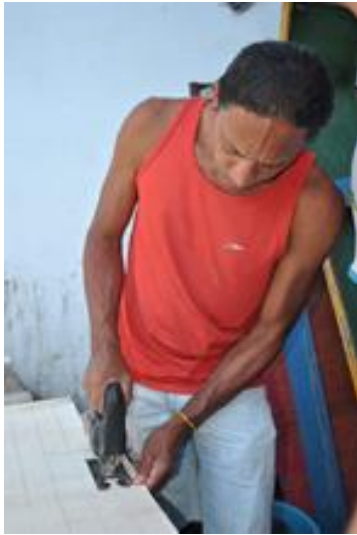
Figura 5 OFICINA CONSTRUÇÃO DE TAMBORES