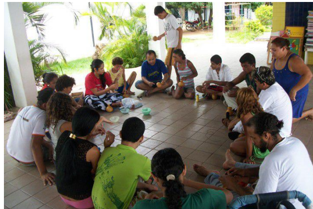
Figura 11 Oficina de construção de XEQUERÊS com alunos da APAE-Crato