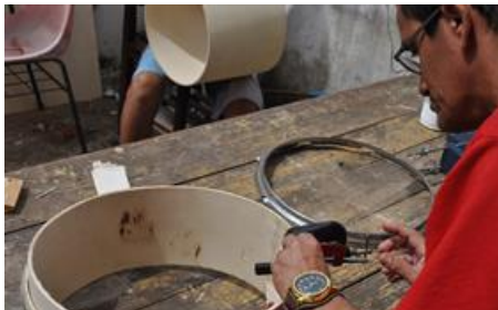
Figura 8 OFICINA CONSTRUÇÃO DE TAMBORES