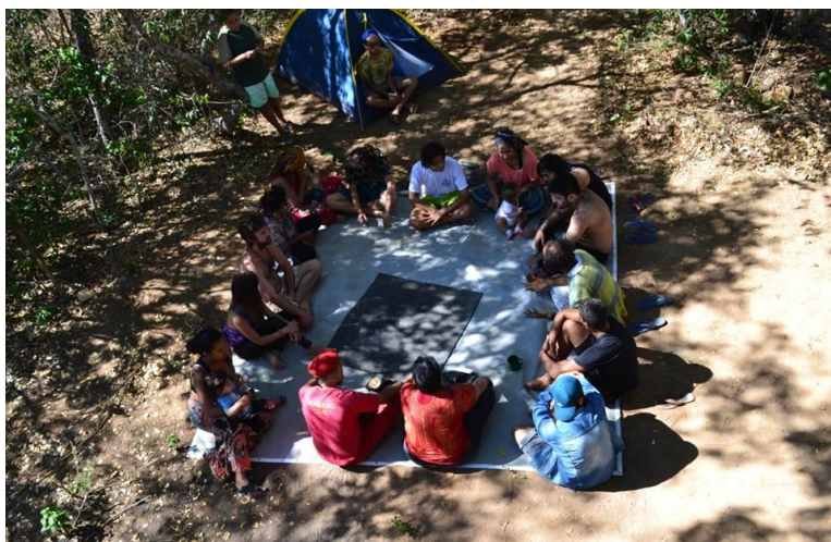
Figura 3 Acampamento Aldeias

Que está presente em todas as ações citadas anteriormente pois a ALDEIAS acredita que a educação é libertária e fundamental no processo de transformação social, cultural, espiritual e ambiental.