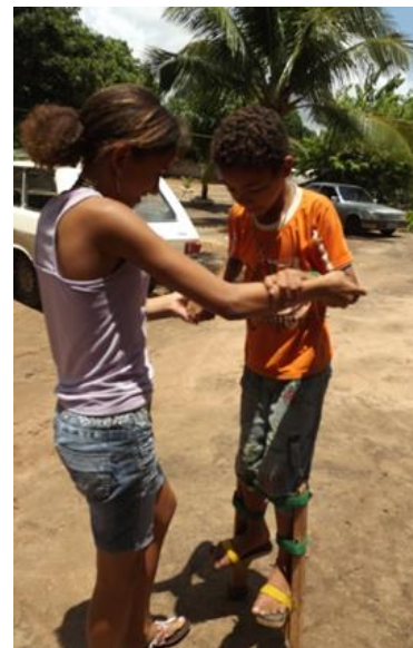
Figura 10 OFICINA DE PERNA DE PAU