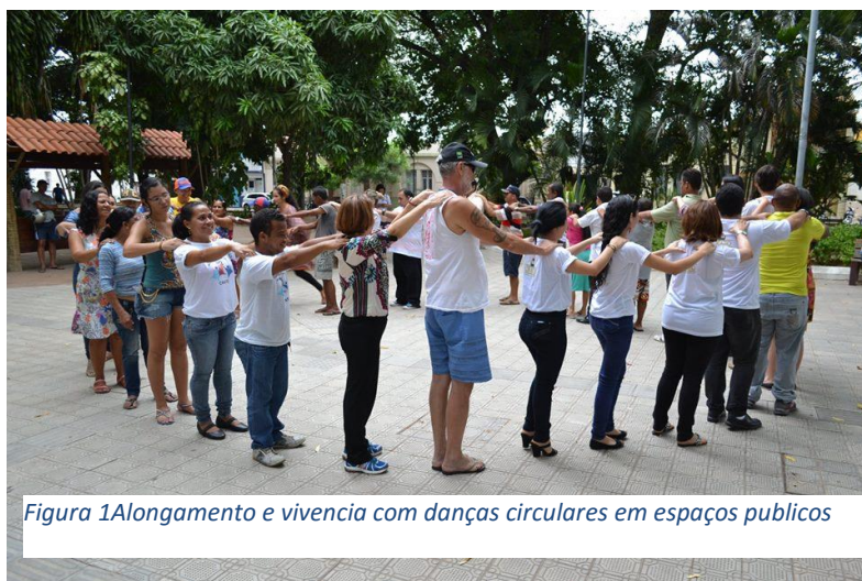
Figura 1 Alongamento e vivencia com danças circulares em espaços publicos