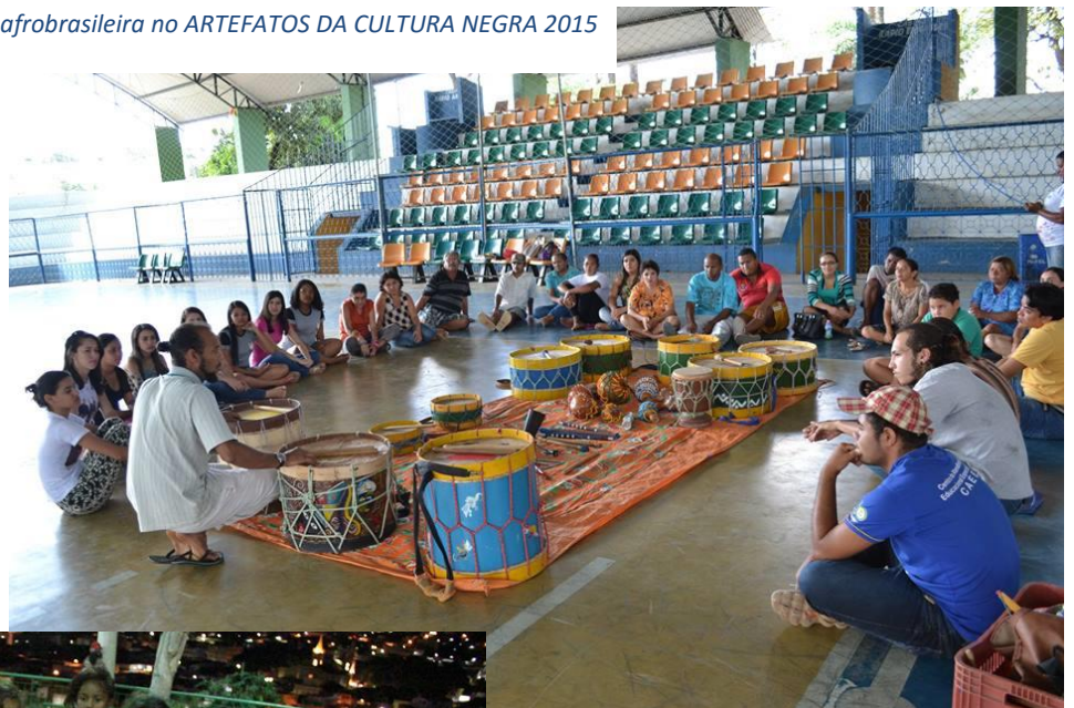
Figura 6 Oficina de música afrobrasileira no ARTEFATOS DA CULTURA NEGRA 2015