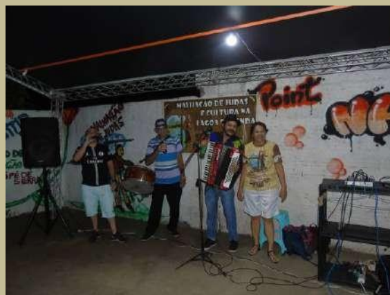
GRUPO FORRÓ PÉ DE SERRA