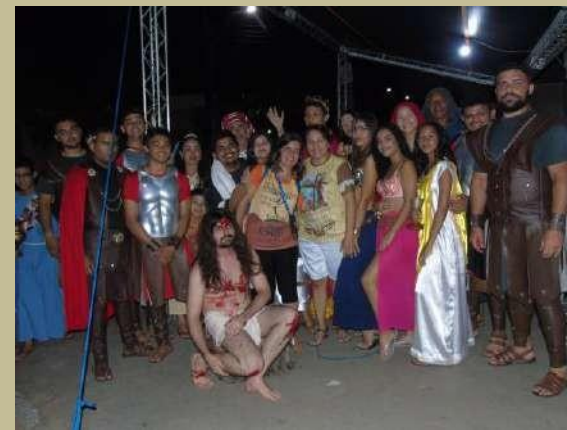
PAIXÃO DE CRISTO