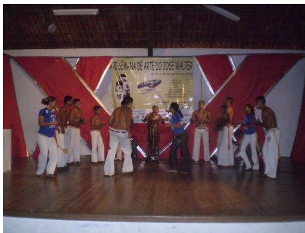
Capoeira Raízes da Terra