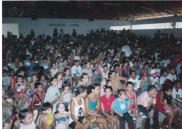
Foto da primeira Semana de Artes