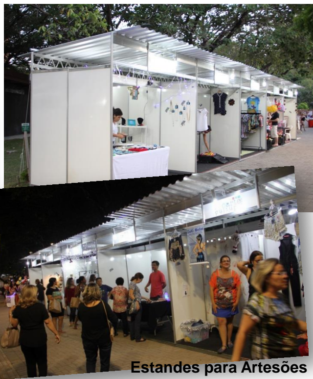
Estandes para Artesões