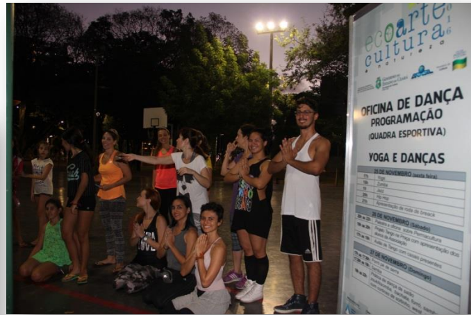
Oficinas de Dança