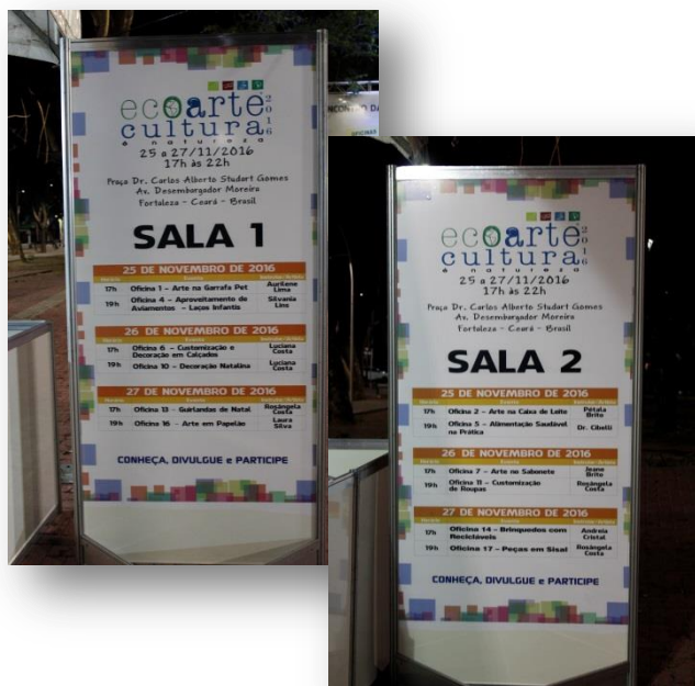
Painéis de Sinalização