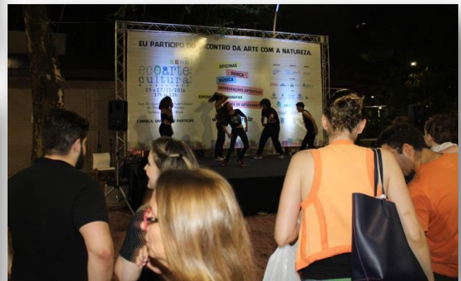
Apresentações de Dança