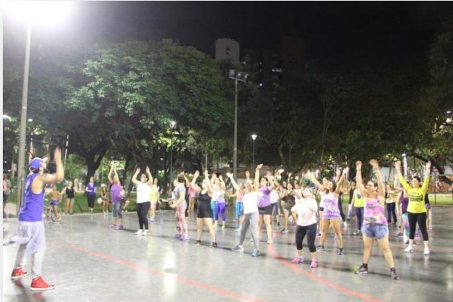
Oficinas de Dança