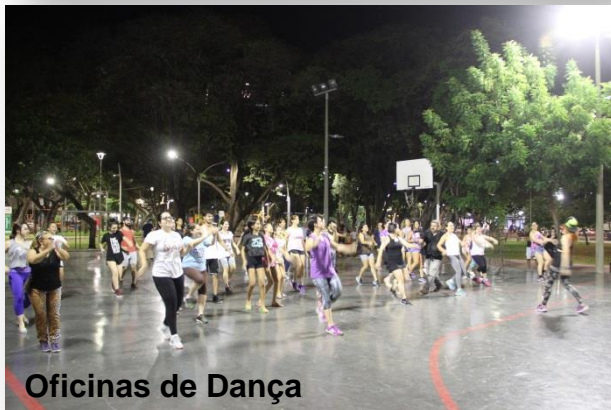
Oficinas de Dança