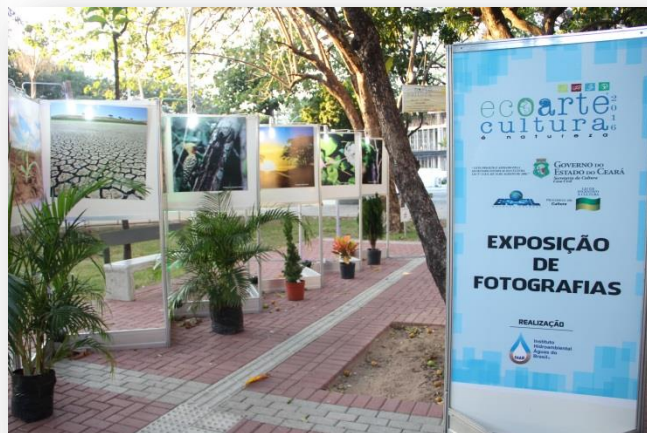
Exposição de Fotografias