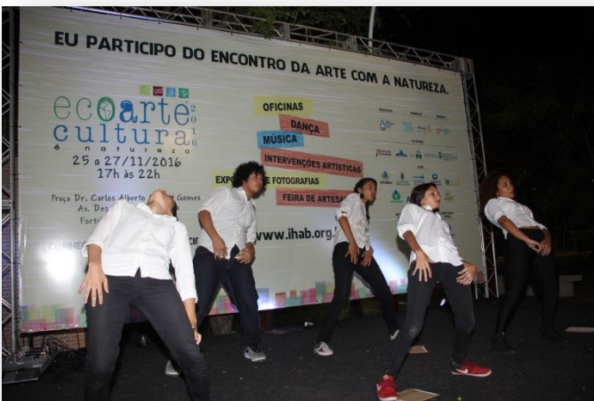
Apresentações de Dança