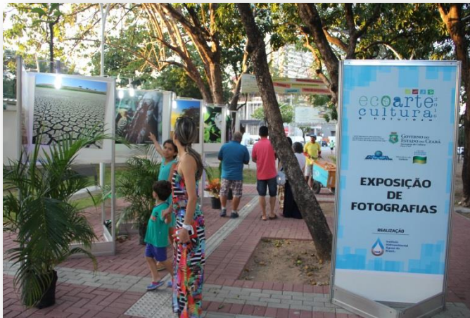
Exposição de Fotografias