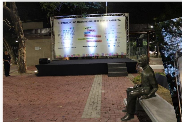
Palco e Painel de Palco