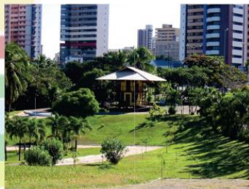
Anfiteatro Parque do Cocó 11/11/2013