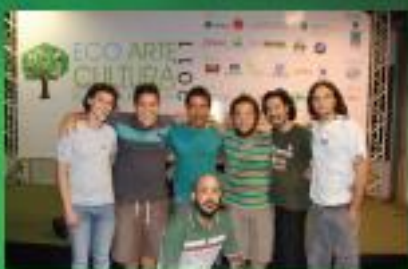
APRESENTAÇÃO DE MÚSICA INSTRUMENTAL ÁGUA DE QUARTINHA