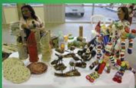
EXPOSIÇÃO DE ARTESANATO