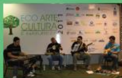
APRESENTAÇÃO DE MÚSICA INSTRUMENTAL DUB INSTRUMENTAL