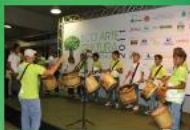
APRESENTAÇÃO DE MÚSICA INSTRUMENTAL PROJETO BRIGADA DA NATUREZA AQUASIS / SESC