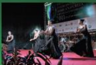
ESPETÁCULO DE DANÇA GRUPO VIDANÇA