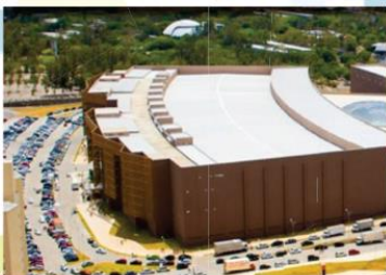
12/11 a 15/11/2013 Centro de Eventos do Ceará