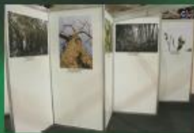
EXPOSIÇÃO FOTOGRÁFICA RÉGIS CAPIBARIBE