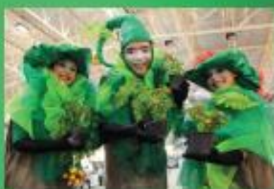
INTERVENÇÃO ARTÍSTICA: GRUPO BLITZ