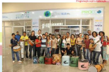
Programação supita 3/11/2014